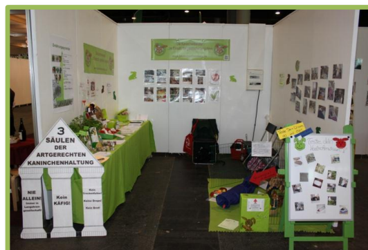
Unser Messestand auf der Maintier 2012: